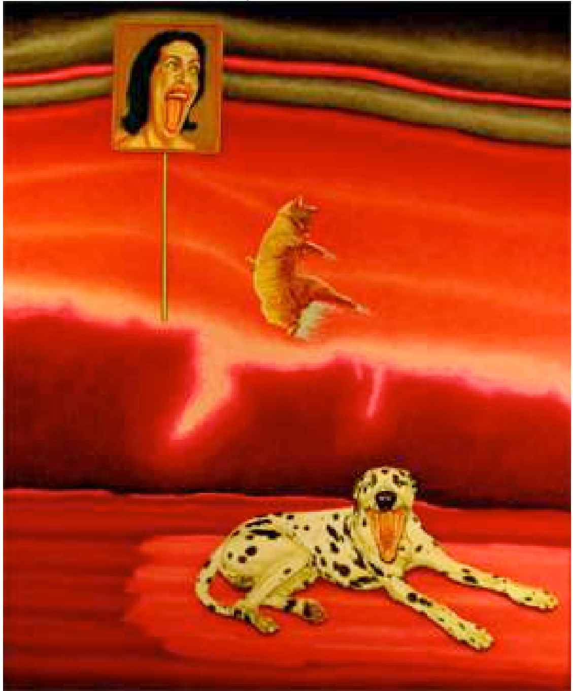
Métamorphose du rire, 2006, 175 x 145 cm