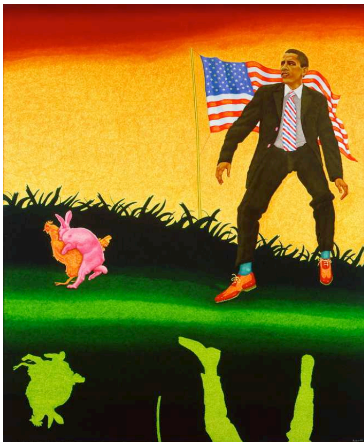
Obama, tout est possible, 2009, 185 x 150 cm.