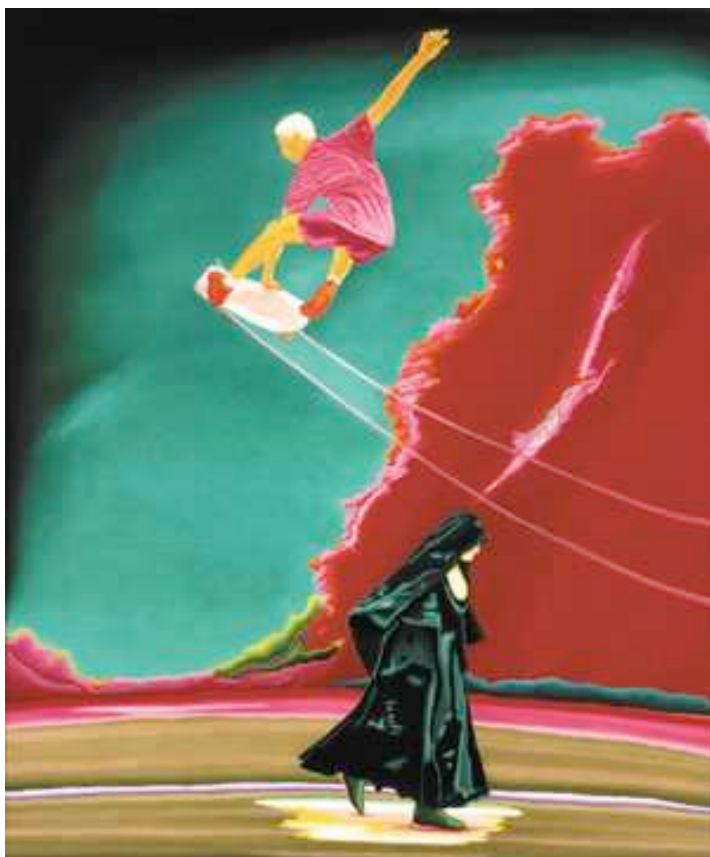
Je saute ma sœur, 1999, 220 x 185 cm.