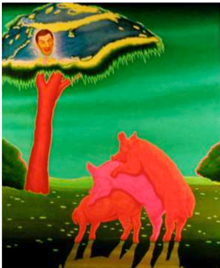
Self service, 2006, 175 x 145 cm.