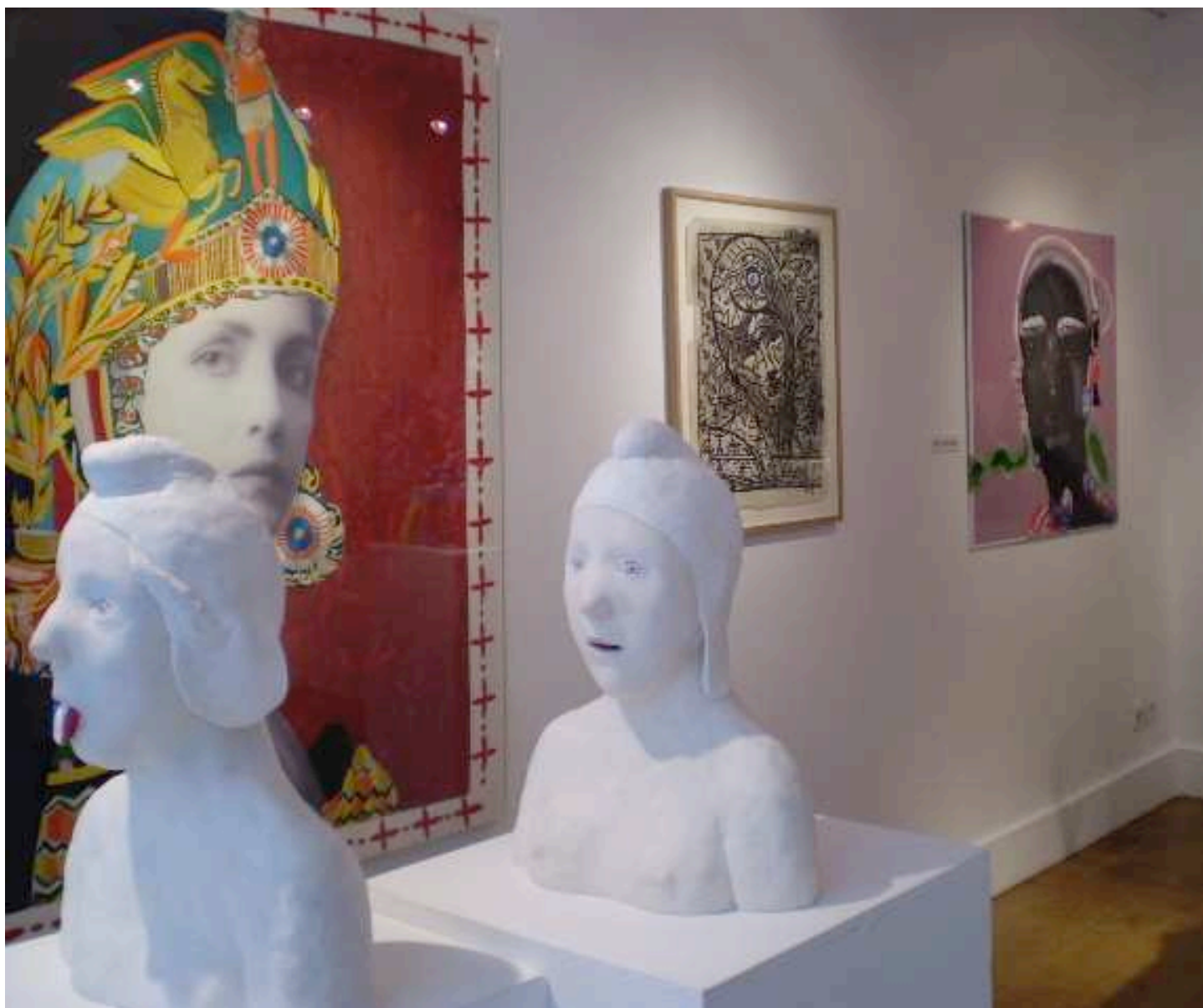
Vue de Marianne , exposition collective, avril 2008.